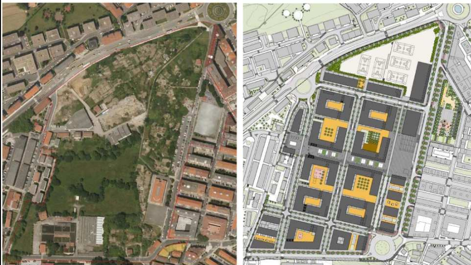
San Migel-Anaka Urbanizatzeko Jarduera Programa, Irun, 2012