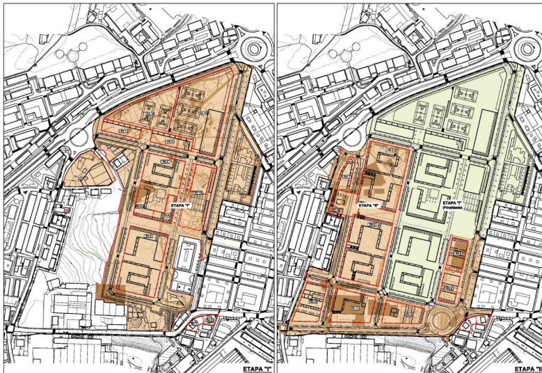
San Migel-Anaka Urbanizatzeko Jarduera Programa, Irun, 2012